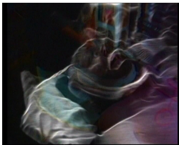
The Commission (1983)

Tanto Steina como Woody, forman parte de este rango de exploraciones, que los han llevado a ser pioneros en el uso de herramientas análogas interviniendo señales de video y sonido, pero fueron más allá, construyendo sus propias herramientas y técnicas, que podían modificar los