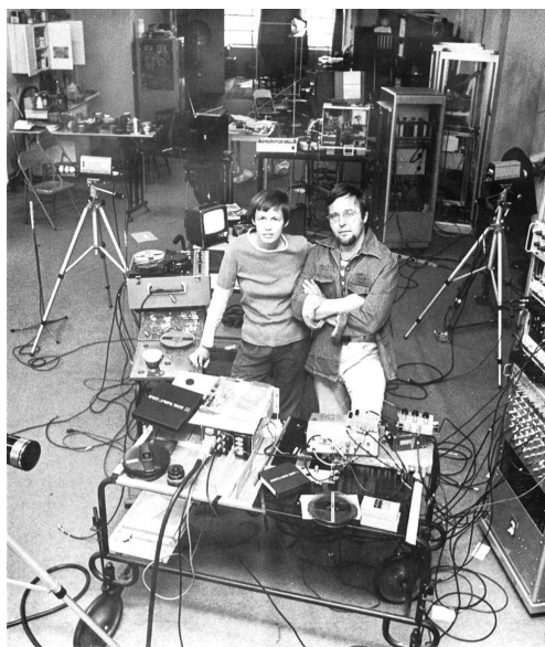
Steina y Woody Vasulka

En 1965 llegan a Estados Unidos, Steina (Islandia, 1940) y Woody Vasulka (República Checa, 1937) instalándose en Nueva York, desde los años '50 la nueva capital del arte. En estos años ('60) la escena presenta bastante actividad, distintas tendencias que cambiaron el rumbo de arte fueron provocados por una nueva generación de artistas plásticos y musicales entre los cuales destacan figuras como Jackson Pollock, William de Kooning, Jasper Johns, Frank Stella, entre otros, entre quienes, un grupo importante, había pasado por el Black Mountain College, donde tendencias como la música experimental de Tudor, Mumma y Cage, el Neodada, y el Action Painting configuran un espacio abierto a la experimentación y a los procesos creativos.